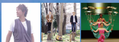
Singer-haru MOGURA 中国雑技団